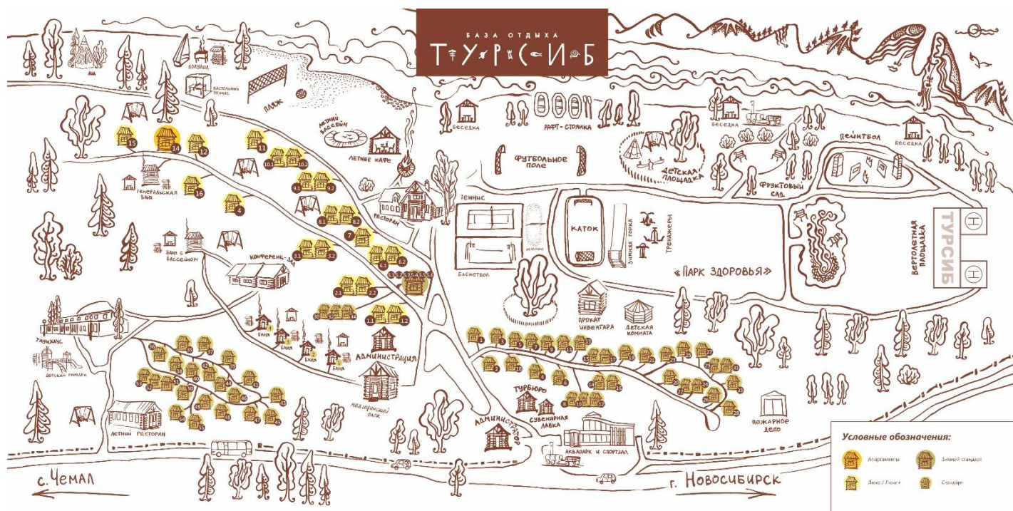
Карта-схема отеля «Турсиб»

Организационная поддержка - компания «Эвент Консалтинг Сервис» www.eventcons.ru